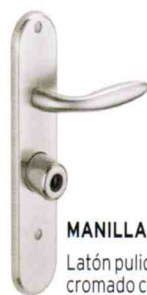
MANILLA Latón pulido o cromado cepillado