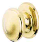
POMO (opcional) PVD latón pulido o cromado terciopelo