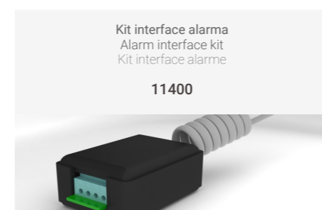
Kit interface alarma Alarm interface kit Kit interface alarme