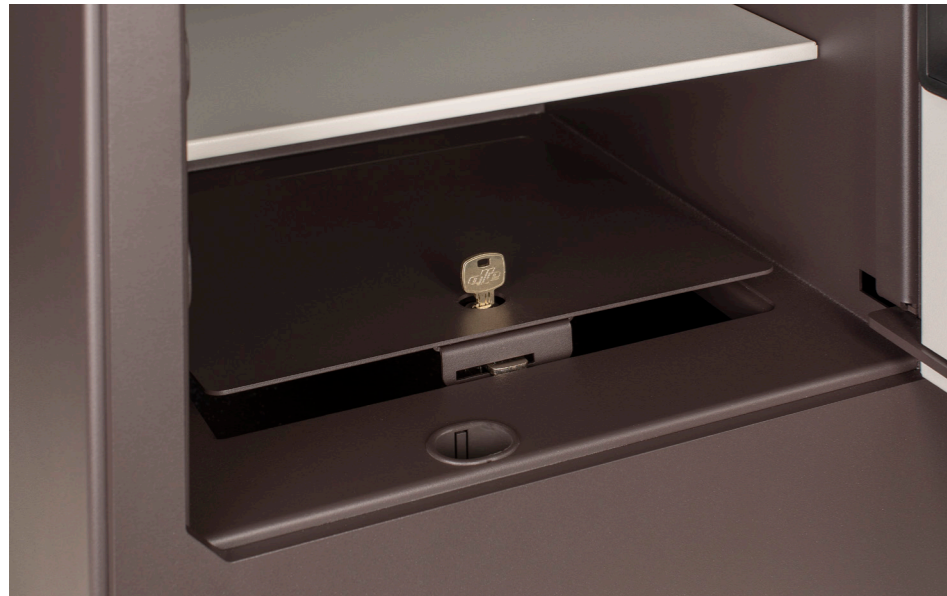
Compartimiento interior oculto (S1005) Inside hidden compartment (S1005) Compartment caché à l'intérieur (S1005)

Les nouvelles fonctions de la serrure allant de la ouverture retardée à code de contrainte pour ouverture. En outre, elle incorpore la technologie bluetooth 4.0 pour se connecter à n'importe quel appareil IOS ou Android à travers d'une application.